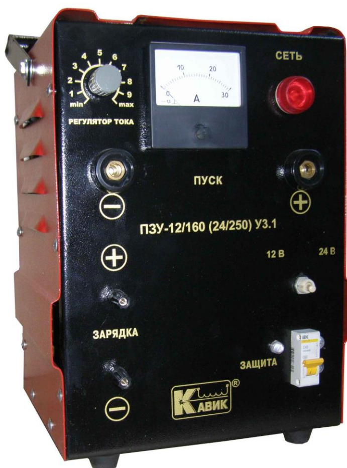
Рис.1. Общий вид ПЗУ

Устройство не рассчитаны на применение в особых условиях (пыль, пары, газы, и т.п.) и на установку во взрывоопасных помещениях.